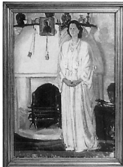
Prințesa Ileana – 1945

din Casa Vămii, aveau un grad mai mic de confort și erau mobilate, de cele mai multe ori, cu paturi de fier, achiziționate, în parte, de la firma Gutman Marcus din București, „Fabrică Specială de Mobile de Fer și Bronz“, care livrează, în luna iulie 1924, 8 paturi englezești, 4 dintre ele cu somieră 49 . În apartamentul de musafiri, în camerele domnului colonel 50 , sau în camerele familiei princiare, se observă aceeași preferință, ca și în castel, pentru covoarele românești, dar și pentru cuverturile sau perdelele din creton 51 . Tablourile preferate, care decorau aceste interioare, erau îndeosebi cele cu teme marine sau