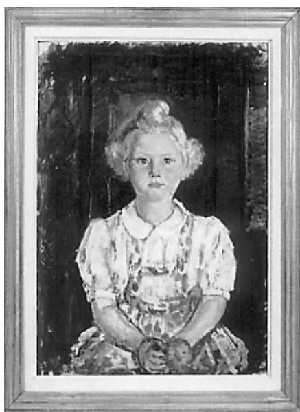
Prințesa Eliseabeta – 1945

Interioarele cuprindeau piese de proveniență diferită, cele mai multe obiecte dispărând după 1948 și doar o mică parte păstrându-se în colecția muzeului. De la dl. Constantin Soare aflăm că mobilierul „rococo“ se afla la vamă în „prima cameră“ 44 , iar conform inventarului din 1938 piesele neorococo erau menționate în odaia 1 (magazie), la parterul pavilionului central, unde existau: biroul, vitrina, masa cu blatul în formă de inimă, noptiera, cele trei canapele, paravanul, bancheta, două fotolii, două scaune și litiera, iar comoda, cele două mese cu blatul rotund și masa cu placă de cristal completau dormitorul dl. col. Zwiedinek, tot la parterul clădirii 45 . În 1948, cele mai multe piese ale acestei garnituri se găseau depozitate în Casa Mare (Colonia A.C.F.) 46 , în Casa Vămii rămânând comoda și masa cu placă de cristal, mutată în camera de toaletă 47 . În biroul domnului colonel Zwiedinek se găsea și o garnitură neorenaștere, incrustată cu os, din care se mai păstrează cele două canapele, un scaun și un fotoliu. 48 Majoritatea camerelor pentru personal, cele din castel, dar și cele