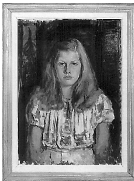
Prințesa Alexandra – 1945