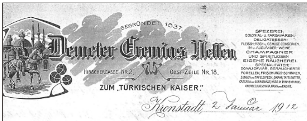
5) Antetul firmei Eremias; în partea dreaptă sunt prezentate specialitățile care i-au creat o faimă binemeritată. De menționat că această categorie de documente reprezintă astăzi o raritate.