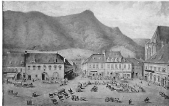
2) Piața Centrală a Brașovului la 1848; în clădirea din stânga – vis-à-vis de Casa Comerțului – se găsea magazinul firmei (reproducere din volumul Das Burzenland , III. 1, planșa 72)