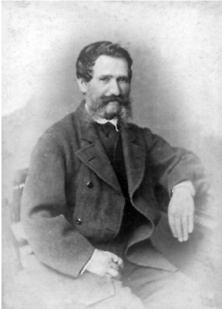
1) Dimitrie Eremias (1817 – 1887)