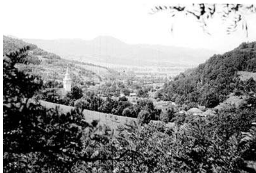
Satul Crișan - vedere spre dealul Caraciu

Ce drapeau, l'un de plus vieux de la Transylvanie, a été confectionné six ans après q'Alexandru Ioan Cuza ait rendu officiel, le 1 septembre 1863, le tricolore comme symbole d'État de la Roumanie. Les couleurs rouge, jaune et bleu font preuve de forts liaisons qui unissent les Roumains habitant les versants des Carpathes.