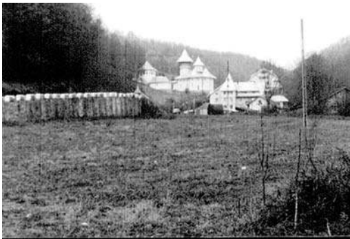
Complexul mănăstiresc Crișan