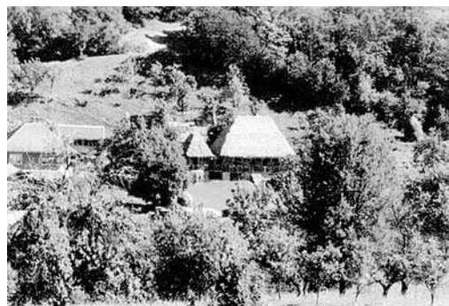
Casa Crișan - vedere din turnul bisericii