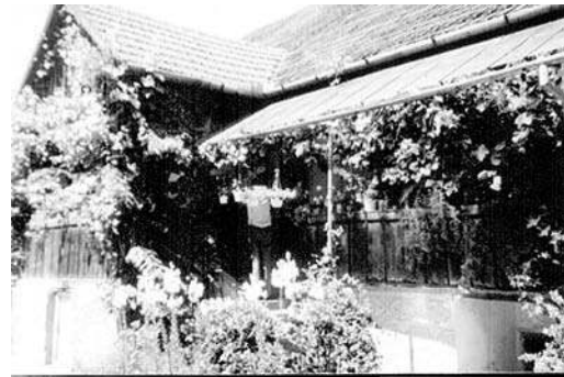
Casa Simionășiu din Baia de Criș