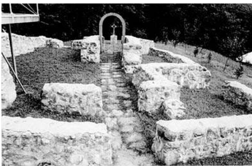
Ruinele Mănăstirii Vaca