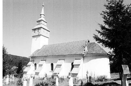
Biserica ortodoxă Crișan