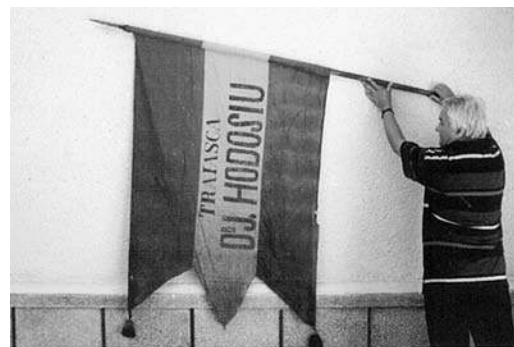
Steagul tricolor din anul 1869