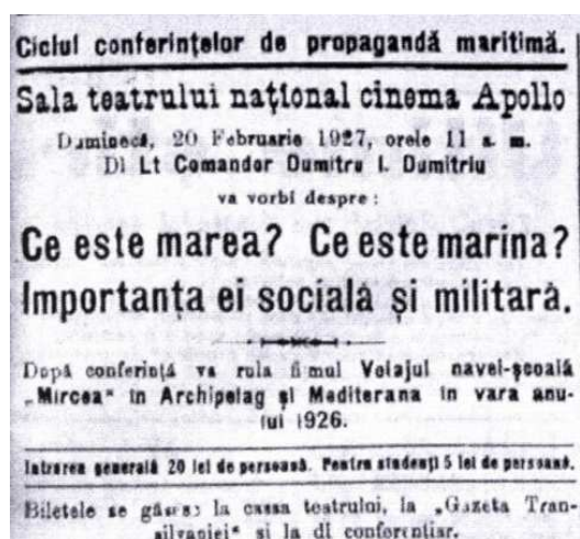
G.T., nr. 15, 11 febr. 1927

Potrivit reclamelor publicate în ziarele „Carpații” și „Gazeta Transilvaniei”, brașovenii au avut posibilitatea să vizioneze, în anul 1927, la cinematograful de sub egida ASTREL, cele mai recente și cele mai populare filme ale timpului, aproximativ optzeci de filme într-un an, în jur de cinci filme noi lunar (Anexa I). În general, filmele erau