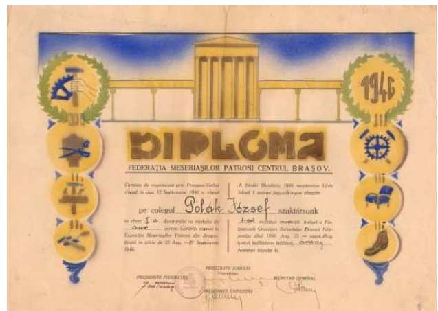
Foto 8. Diplomă acordată meșterului Polák József, în atelierul de tâmplărie, Brașov, anii '20 Brașov, 12 septembrie 1946.