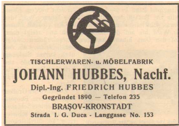
Fig. 1. Johann Hubes - reclamă