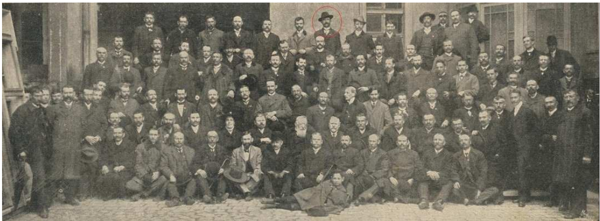
Foto 6. Congresul Asociației Generale a Tâmplarilor, Budapesta, 1910. În medalion, reprezentantul Asociației Tâmplarilor din Brașov.