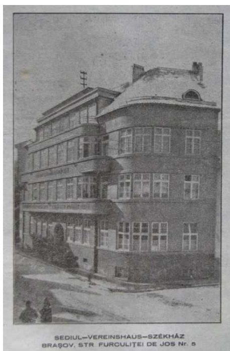
Foto 3. Sediul Corporației din Brașov.