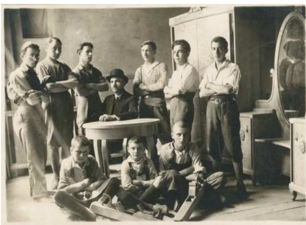
Foto 7. Patronul, meșterii, ucenicii și calfele