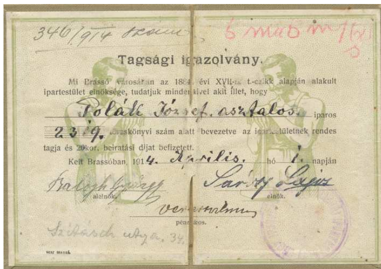
Foto 4. Carte de membru, Asociația tâmplarilor din Brașov