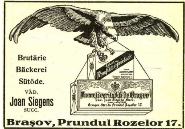
Fig. 2. Brutăria Siegens - reclamă