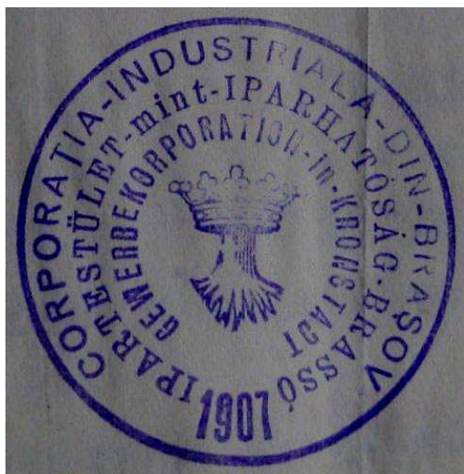
Foto 1. Ștampila Corporației Industriale Brașov