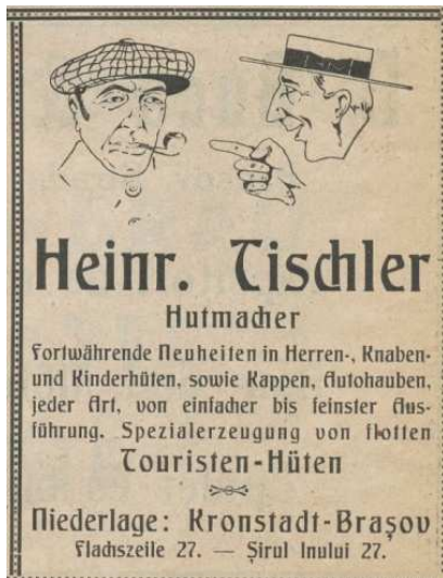
Fig. 3. Pălărier Heinr. Tischer - reclamă -