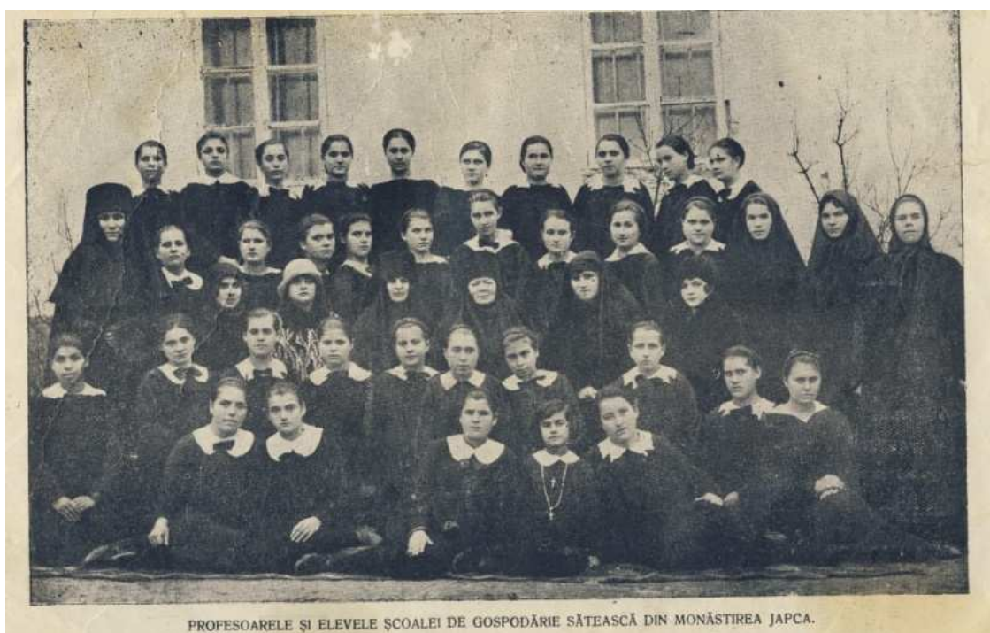
Profesoarele și elevele Școlii de Gospodărie Sătească de la mănăstirea Japca, cca 1930 (după „Anuarul Episcopiei Hotinului. Foaie Eparhială Oficială”, Bălți, Tipografia Eparhială „Cartea Românească”, 1930, p. 17)

Parte componentă a culturii naționale, învățământul religios, inclusiv cel de la mănăstirea Japca, a contribuit substanțial la edificarea și consolidarea statului unitar românesc.